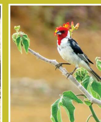
Cardeal do nordeste