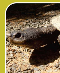
Cágado do nordeste